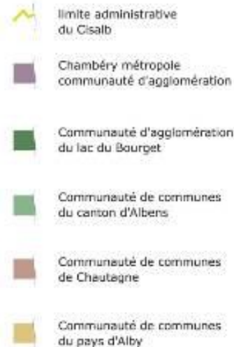
Les communes du bassin versant du lac du Bourget